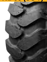
NB 38 (SG 7)*